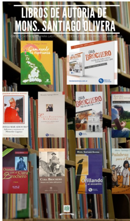
CON CADA COMPRA LAS REGALÍAS Y GANANCIAS POR DERECHOS DE AUTOR SON DONADAS AL SOSTENIMIENTO DEL SEMINARIO DIOCESANO.